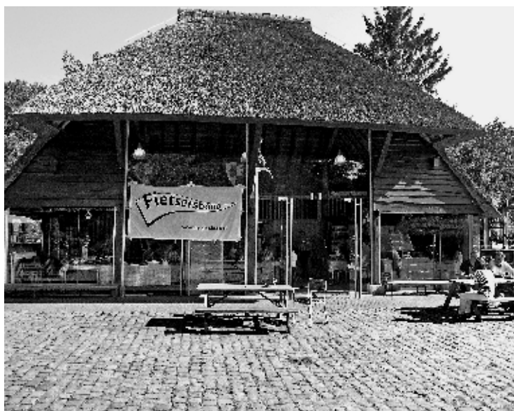
Gasterij In 't Ven

Alles ging gelukkig zoals gepland en zo waren er op zaterdagmiddag 8 juni een veertigtal mensen bij de feestelijke presentatie van Ventiel 150.