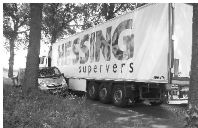
Burgemeester Termeerstraat: Een échte industriële ontsluitingsweg, dat zie je zo

Wij hopen dat de gemeenteraad voldoende gezond boerenverstand heeft om aan deze klucht een eind te maken.