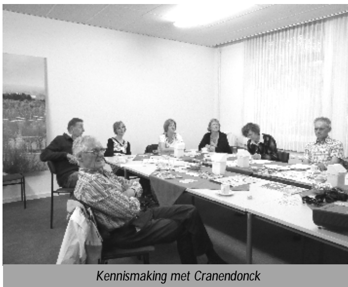
Kennismaking met Cranendonck

Hoewel dat misschien niet zo succesvol lijkt, was de avond toch buitengewoon interessant en informatief. Aan