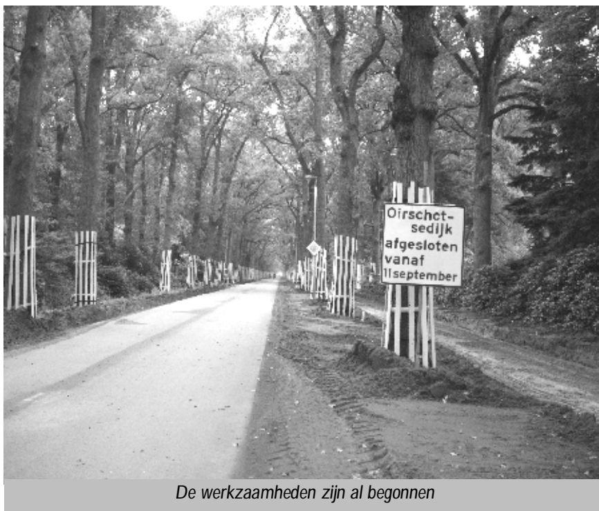
De werkzaamheden zijn al begonnen

(Bewerking van een persbericht van de Gemeente Eindhoven)