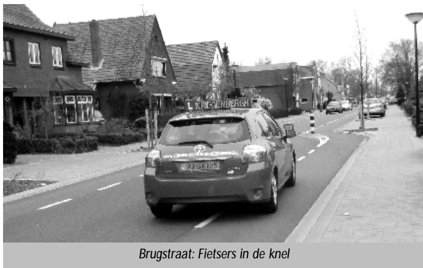
Brugstraat: Fietsers in de knel

De snelheidsremmers in de vorm van chicanes werken niet als er maar weinig (auto)verkeer is; en als er veel verkeer is worden de fietsers weggedrukt. In Ventiel 150 is daar al