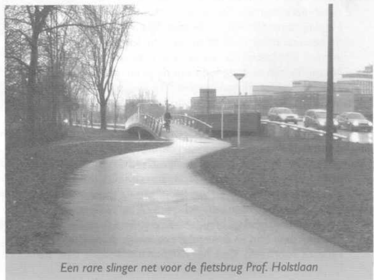
Een rare slinger net voor de fietsbrug Prof. Holstlaan