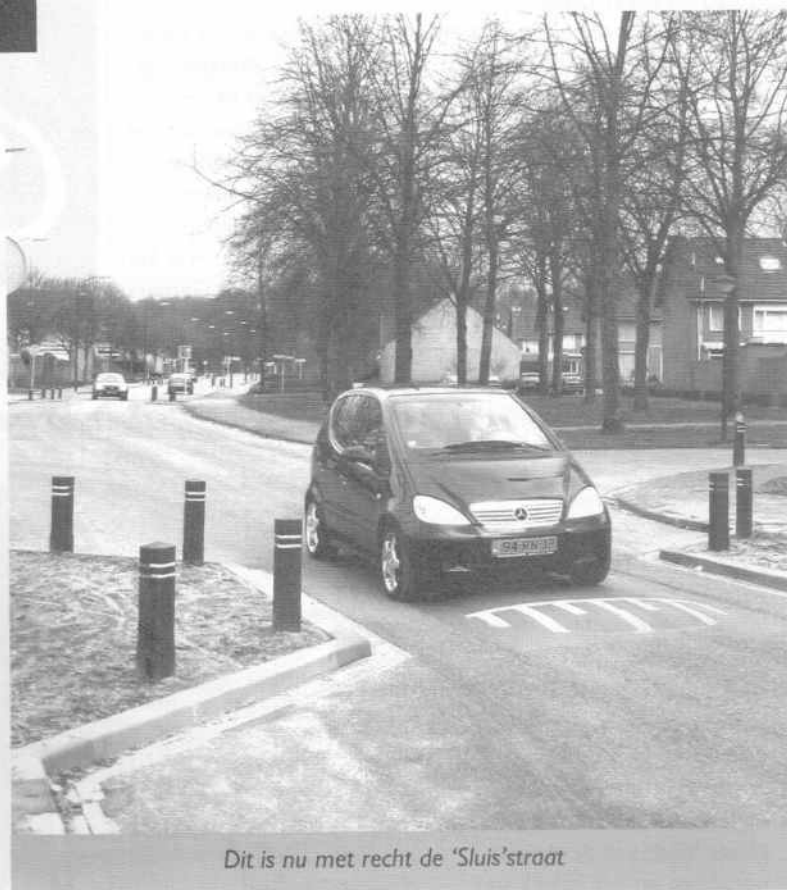
Dit is nu met recht de 'Sluis'straat

Samen met Wijkvereniging Coevering heeft de Fietsersbond brieven geschreven naar de gemeente, een gesprek gehad met de wethouder, de publiciteit gezocht en gekregen en uiteindelijk ook nog het woord gericht tot de gemeenteraad. Uiteindelijk heeft de gemeenteraad de wethouder op de vingers getikt en ervoor gezorgd dat de sluisjes alsnog worden voorzien van fietspaadjes, een mooi en ook veilig resultaat. Alleen jammer dat het niet meteen van begin af aan goed is uitgevoerd, reden te meer om alle plannen van de gemeente zorgvuldig te bekijken. In verband met de daarvoor benodigde tijd zouden we in Geldrop best nog wel een extra bestuurslid erbij kunnen gebruiken.