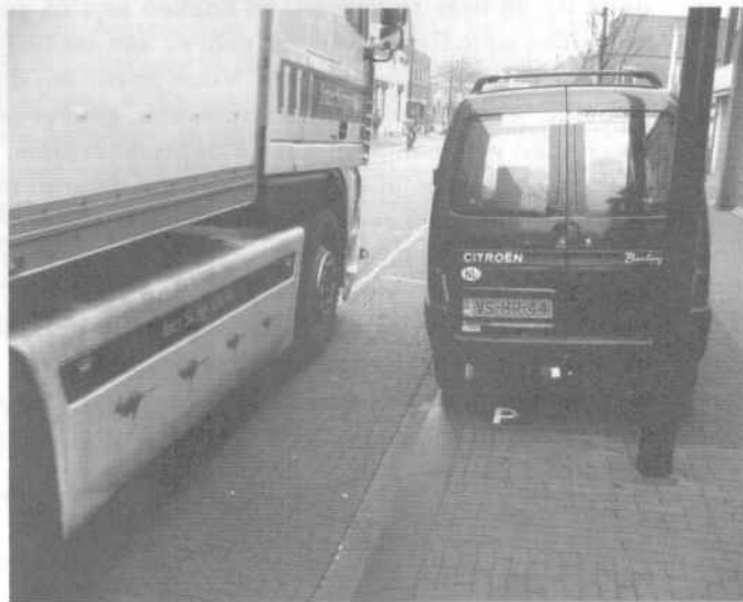
Kapelstraat in Heeze

Ventiel-lezers kunnen al vele nummers de klucht over de Kapelstraat volgen. In 2004 is de weg heringericht, en op deze nu smallere maar nog steeds drukke weg fungeren alleen de fietsers als snelheidsremmer. Deze herinrichting is er door een vorige CDA-wethouder doorgedrukt. Hij is in dat jaar samen met zijn collega's weggestuurd. In 2005 leek het nieuwe college bereid toch maatregelen te willen nemen voor de fietsers en de veel veiligere 30 km/u keuze wel te willen maken. Hoewel de huidige wethouder van verkeer zelf voorstander van 30 km/u is, vindt het college als geheel de problemen voor fietsers niet belangrijk genoeg om er geld aan uit te geven. Vandaar dat de Fietsersbond de lopende procedures tegen de gemeente heeft voortgezet.