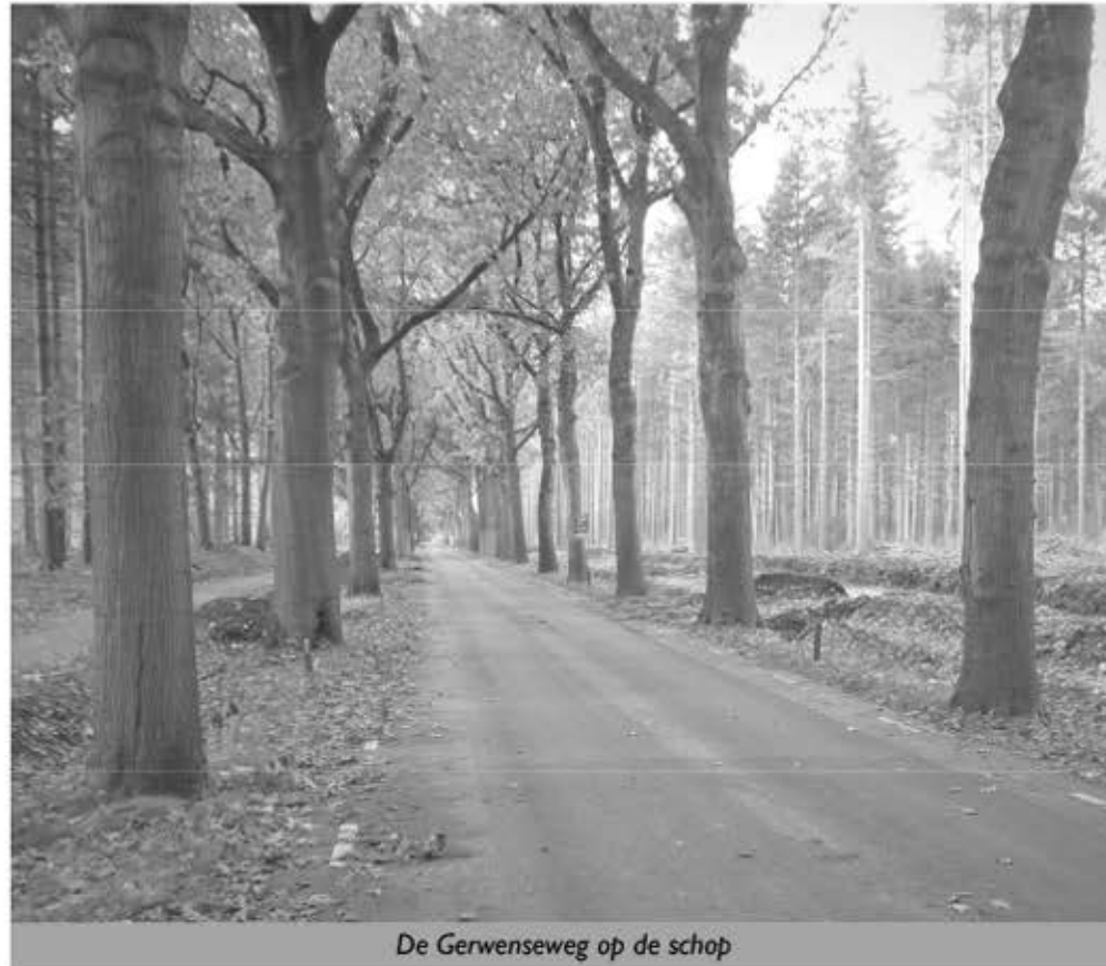
De Gerwenseweg op de schop

Gedragsacties zoals voor de beperking van de maximumsnelheid rond scholen en in woonwijken of de jaarlijkse fietsverlichtingsactie komen zo onvoldoende uit de verf.