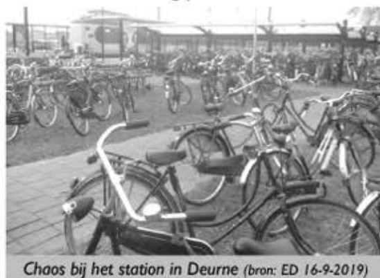
Chaos bij het station in Deurne

Op dit moment is een bord geplaatst waarin mensen 'te lief' wordt verzocht hun fietsen in het rek te plaatsen. Maar dit werkt niet. Als je nu bij het station aankomt zou je denken dat er te weinig ruimte in de fietsenstallingen is, maar twee van de drie fietsenstallingen hebben ruim voldoende stallingsplaatsen. Maar doordat mensen niet verder