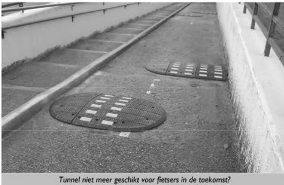
Tunnel niet meer geschikt voor fietsers in de toekomst?

De doorgaande route door Leende naar Heeze via de Langstraat en de Oostrikkerstraat, wordt heringericht. Je zou verwachten dat dat gebeurt volgens de huidige verkeersinzichten. Dus of 50km/h