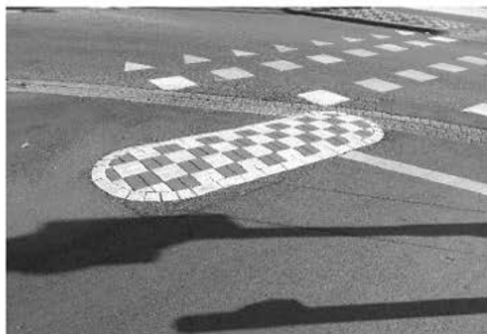
Dit een goede middengeleider

Toegang van ventwegen: Bv langs de ring (gaat met name om plaatsen waar geen snelheidsbepalende maatregelen zijn genomen voor auto's die de ventweg opschieten). Stuur ons foto's van straat/kruispunt en plaats waar men te hard de ventweg op kan rijden omdat er geen snelheidsremmers zijn. Paaltjes waar ze echt geen toegevoegde waarde hebben. Stuur ons foto's van straat/kruispunt en plaats waar het paaltje geplaatst is.