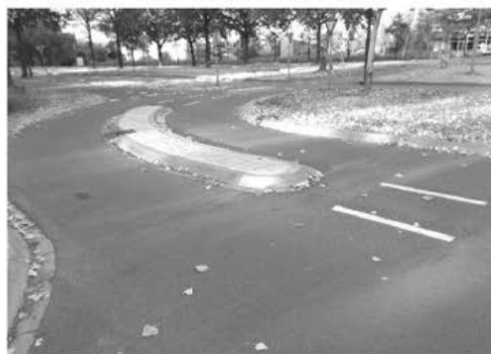
Dit is een gevaarlijke dus slechte middengeleider.