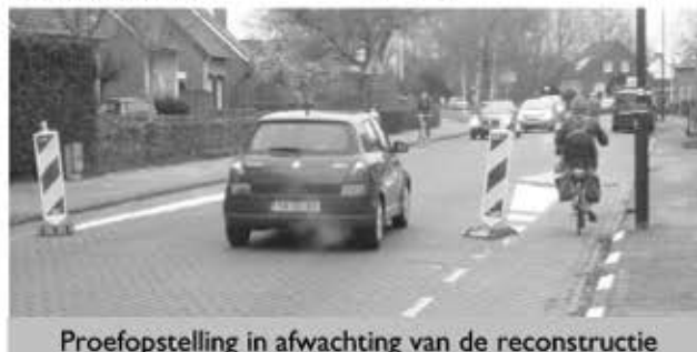
Proefopstelling in afwachting van de reconstructie

Laat we afsluiten met een aardig kiekje. De St. Annastraat in Gemert-kern. Goed voor duizenden passerende auto's per dag, kent een suggestieve fietsbaan. Onderbroken strepen op de rijbaan. Een goedkoop alternatief voor iets dat beter kan. Rood geveerd of liever nog vrij liggend. De reconstructie van deze zeer drukke, te hard rijden en ook nog lawaaierige uitvalsweg hartje Gemert-buitengebied komt er aan. Tot nu toe mogen fietsers nog om geparkeerde auto's laveren of veilig door de wegversmalling zien te komen.