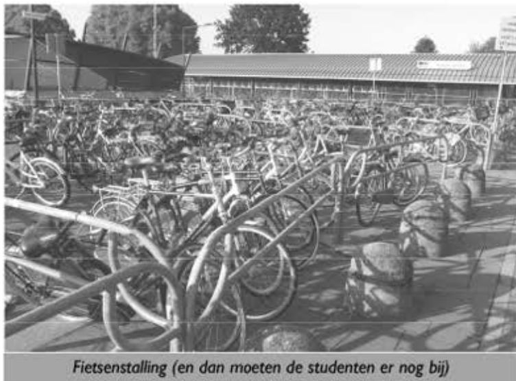
Fietsenstalling (en dan moeten de studenten er nog bij)

In mei 2018 werd de uitbreiding daadwerkelijk geopend en helaas, het was een doorslaand succes. De gemeente had gezegd dat deze uitbreiding een tijdelijke oplossing was, want er zou eind 2018 een andere, professionelere (vermoedelijk dus ook duurdere) uitbreiding komen. Die professionele versie hebben we nog niet zien langskomen, maar we kunnen wel constateren dat de 'tijdelijke' stalling stamp- en stampvol is. Zelfs in augustus, wanneer het onderwijs in Eindhoven stilligt en veel forensen vrij zijn, is de stalling heel goed bezet. Dus hoe dat precies eruit gaat zien zodra iedereen in september weer terug is en met de trein wil reizen: we houden ons hart vast.