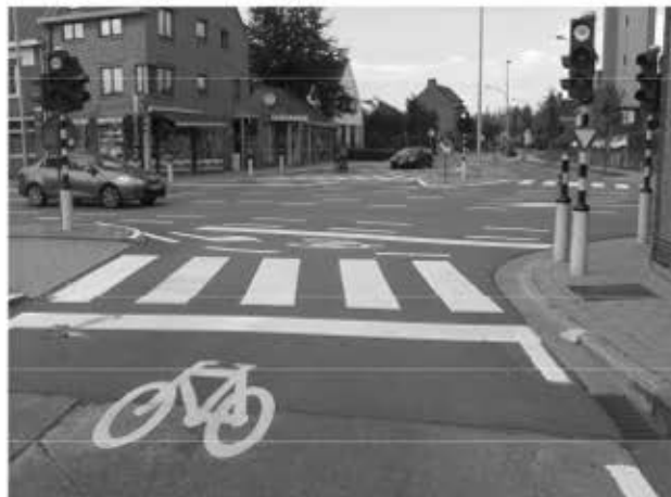
Een opgeblazen fietsopstelstrook (OFOS)

Aan de andere kant: Dit viaduct zou er vandaag de dag niet meer gekomen zijn.