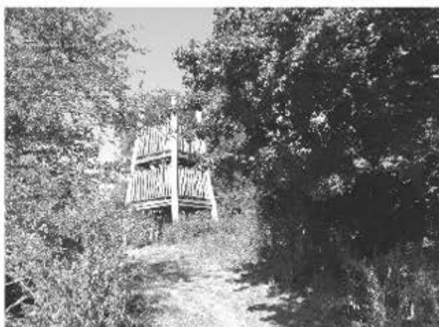
Eén van de natuurparels in de gemeente Laarbeek. Dit is de uitkijktoren in natuurgebied Keelgras tussen Lieshout en Mariahout

We vrezen dat er vanwege de financiële situatie in Laarbeek (de gemeente zit financieel diep in het rood) weinig tot niets met de fietsaanbevelingen uit dit rapport gedaan zal worden. Zodra er tekenen zijn van herstel gaan we dat natuurlijk weer aankarten. Helaas het is niet anders.