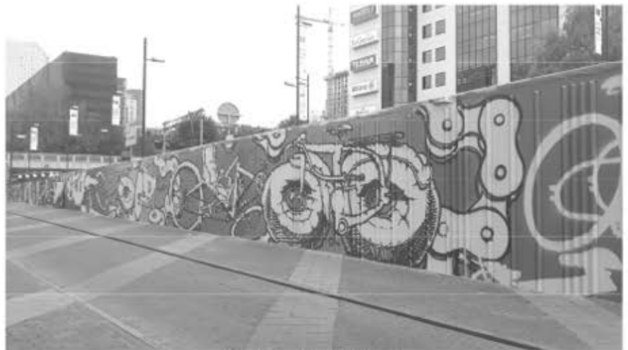
Tunnelkunst in Eindhoven

Behalve bij het station staat er nu ook op de Markt in Deurne voortaan een fietspomp, hier komt binnenkort nog een watertappunt bij te staan. Michel Lintermans