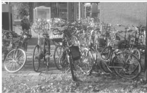
Geen doorkomen aan

In Eindhoven loopt al langer een project waarmee wordt geprobeerd tunnels aangenamer te maken voor het oog en daarmee ook de sociale veiligheid een steuntje te geven. We geven hier een voorbeeld uit de buurt van het station. Pieter Nuiten