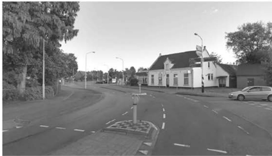
De huidige situatie in Oostelbeers

Het is de bedoeling dat het voor fietsers en voetgangers veiliger wordt om over te steken door de toepassing van verkeerslichten.