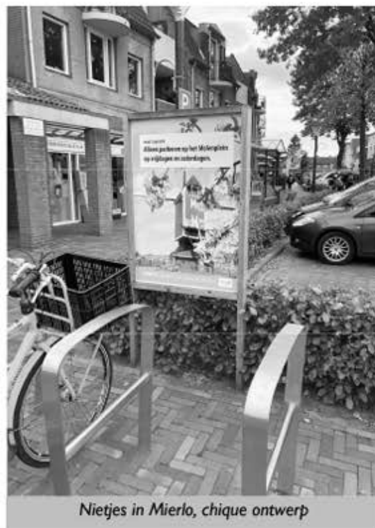
Nietjes in Mierlo, chique ontwerp

Bij nader inzien kun je in ieder geval een paar fietsen tot ongeveer bij de kassa van de Plus stallen, dat dan weer wel. Gelukkig kost het niet al te veel moeite om straks autoparkeerplaatsen om te bouwen tot fietsparkeerplaatsen, dat vertienvoudigt de capaciteit. En in Geldrop gaan we hopelijk niet dezelfde kant op met de parkeerkuil tegenover de Nettorama en de AH, dat moet meteen een groene fietsparkeerplaats worden!