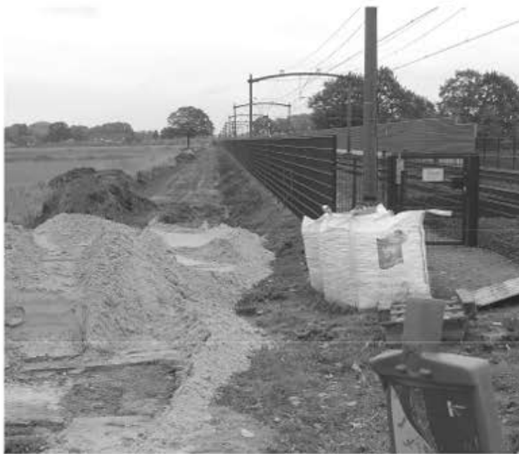
Er is nog wel wat werk aan de winkel

Graag hadden wij gezien, dat deze route al volop in bedrijf zou zijn. Uiteindelijk zijn de eerste ideeën al van meer dan 20 jaar geleden.