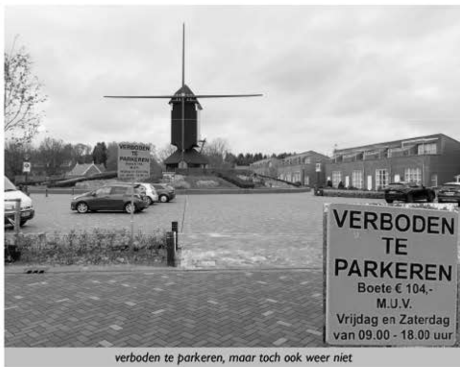
verboden te parkeren, maar toch ook weer niet

Er gaat geen nieuwsuitzending voorbij zonder het woordje weggijken. De overheid kijkt niet langer meer weg als het gaat om het aanpakken van de georganiseerde drugscriminaliteit en laat dat ook luid en duidelijk weten. Maar op een ander beleidsterrein wordt er nadrukkelijk wel weggekeken. De overheid moet stoppen met weggijken op de weg, de overheid moet meer op de weg kijken.