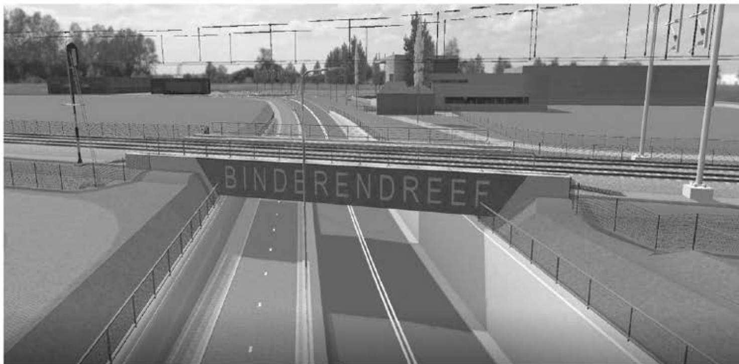
Viaduct Binderendreef in Deurne

Alle rotondes die niet in het centrum van Deurne liggen zijn zo