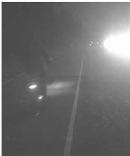
Fietsen in het donker

tussen Gemert en Beek en Donk, het fietspad links is een twee richtingen fietspad en totaal onverlicht. Tegemoetkomend autoverkeer verblindt de fietser! De foto gemaakt om half 6 in de namiddag. Hoe onveilig is deze situatie, ook en vooral voor meisjes en vrouwen, helaas. Heb de situatie aangekaart in de werkgroep duurzame mobiliteit waarin o.a. de wethouder mobiliteit, ook vrouw! Dies van Soelen