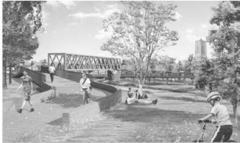
Oirschot, toch een beetje lomp hoor, die brug