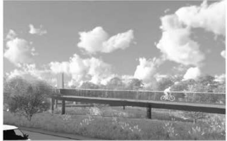
Toch een stuk eleganter

Op de website van het Eindhovens Dagblad van 31 oktober 2018 stond dat bouw van de brug die de nieuwbouwwijk Moorland met het centrum van Oirschot moet gaan verbinden vertraagd wordt.