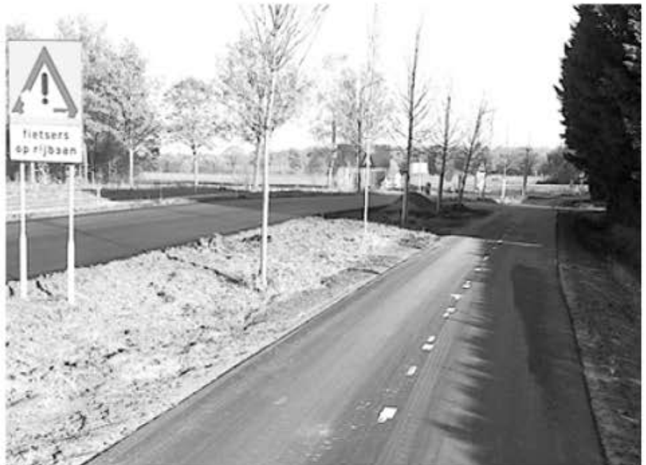
We naderen Lieshout, einde fietspad!

De afgelopen maanden heeft de gemeente het fietspad tot de