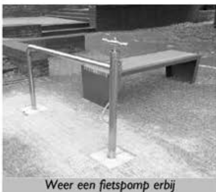
Weer een fietspomp erbij

Behalve bij het station staat er nu ook op de Markt in Deurne voortaan een fietspomp, hier komt binnenkort nog een watertappunt bij te staan. Michel Lintermans