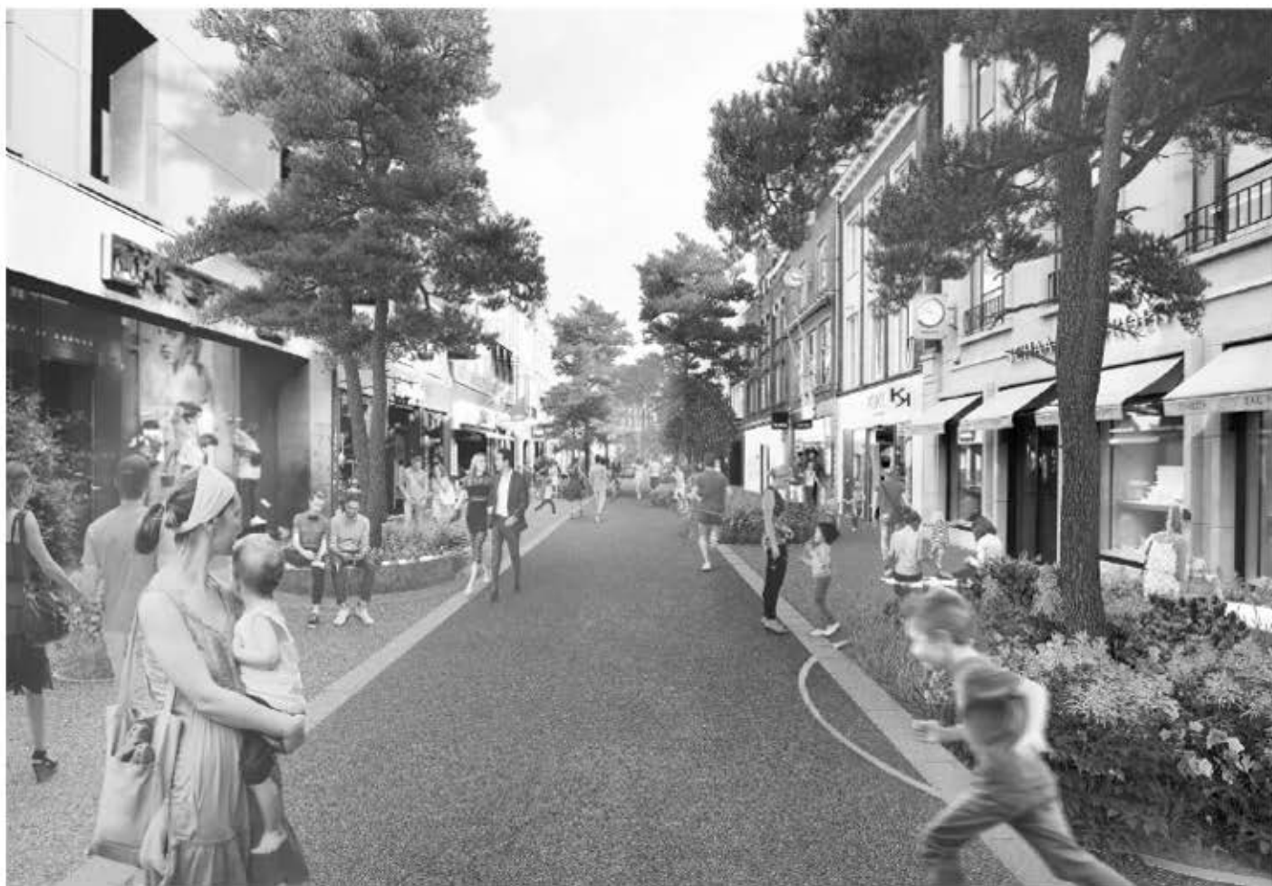
Een voorproefje van de Demer (site gemeente Eindhoven)

We horen graag de mening van onze leden via eindhoven@fietsersbond.nl . Voor meer informatie kun je ook de website van de gemeente bezoeken. Zoek dan naar 'boeiende binnenstad'.