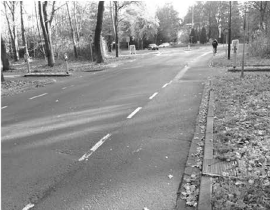
Prachtig fietspad Gentiaanlaan, onduidelijke oversteek Afrikalaan

is opnieuw aangelegd. In plaats van tegels ligt er nu een mooi rood dubbelzijdig fietspad. We overleggen met de gemeente hoe de oversteek met de Afrikalaan veiliger gemaakt kan worden voor