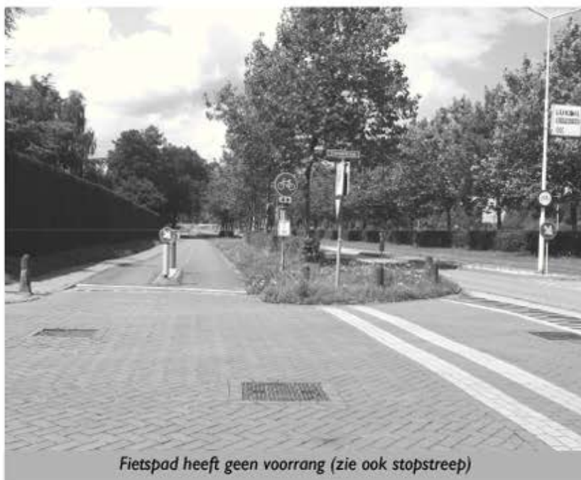
Fietspad heeft geen voorrang (zie ook stopstreep)