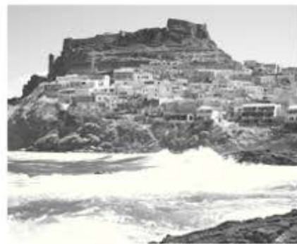
De rotspunt Castelsardo.