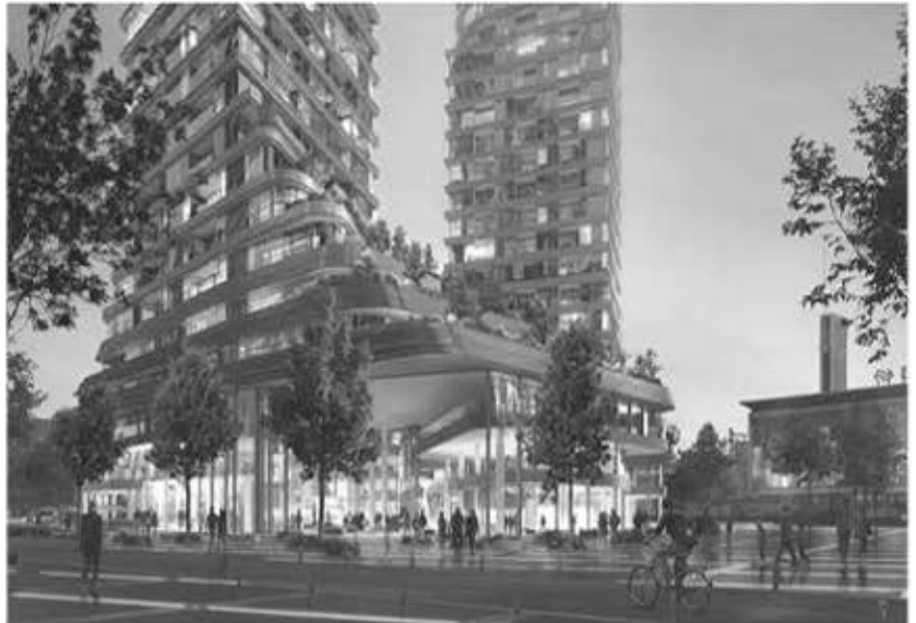
Stationsgebied Zuid, Plan Amvest

Tijdens de drie kwartier durende presentatie was er veel aandacht voor het uiterlijk van het plan (skybars, terrassen),