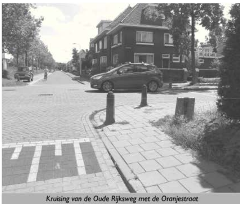
Kruising van de Oude Rijksweg met de Oranjestraat

Wie ter plaatse bekend is, kent natuurlijk de situatie en zal niet gauw in problemen komen. Maar wat vinden degenen die hier niet dagelijks langskomen? Het zou fijn zijn als die mensen, dus met name ook de wielrenners onder u hun mening ventileren over deze situatie. Reacties graag naar ottrans@iae.nl , zodat ik bij de gemeente niet alleen vanuit persoonlijke ervaring en inzicht spreek.