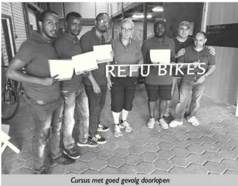
Cursus met goed gevolg doorlopen

In het vorige Ventiel was een berichtje opgenomen over een project voor jonge vluchtelingen die via het Jongerenhuis Eindhoven leerden fietsen te herstellen onder begeleiding van vrijwilligers. Dat Ventiel goed wordt gelezen, was te merken geweest, want er werden meteen diverse fietsen aangeboden voor het project. Dankbaarheid dus van de werkers die ons vroegen hun nieuwe telefoonnummer ook door te geven: Leerbedrijf Refu-Bikes 06-82351168. Ze zijn ook nog op zoek naar een vrijwilliger.