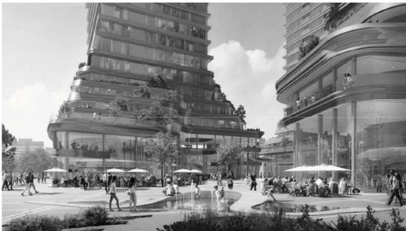
Stationsgebied Zuid, geen fiets te zien