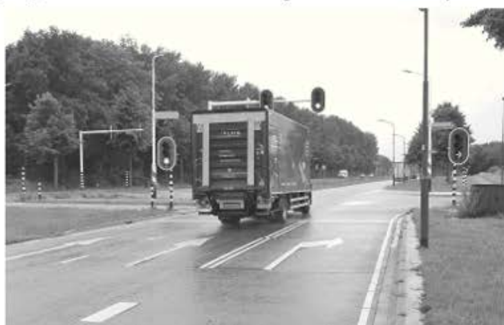
Zorgen om dit kruispunt op de N270

Van 18 tot en met 21 juli is vanuit vier locaties de fietsvierdaagse van de Peel gereden. Wij hebben vanuit Stiphout meegedaan met een kleine duizend andere fietsers. Twee dingen die ons erg opvielen: er deden veel kinderen mee, samen met hun ouders of grootouders en er was een onevenredig groot aantal e-bikers.