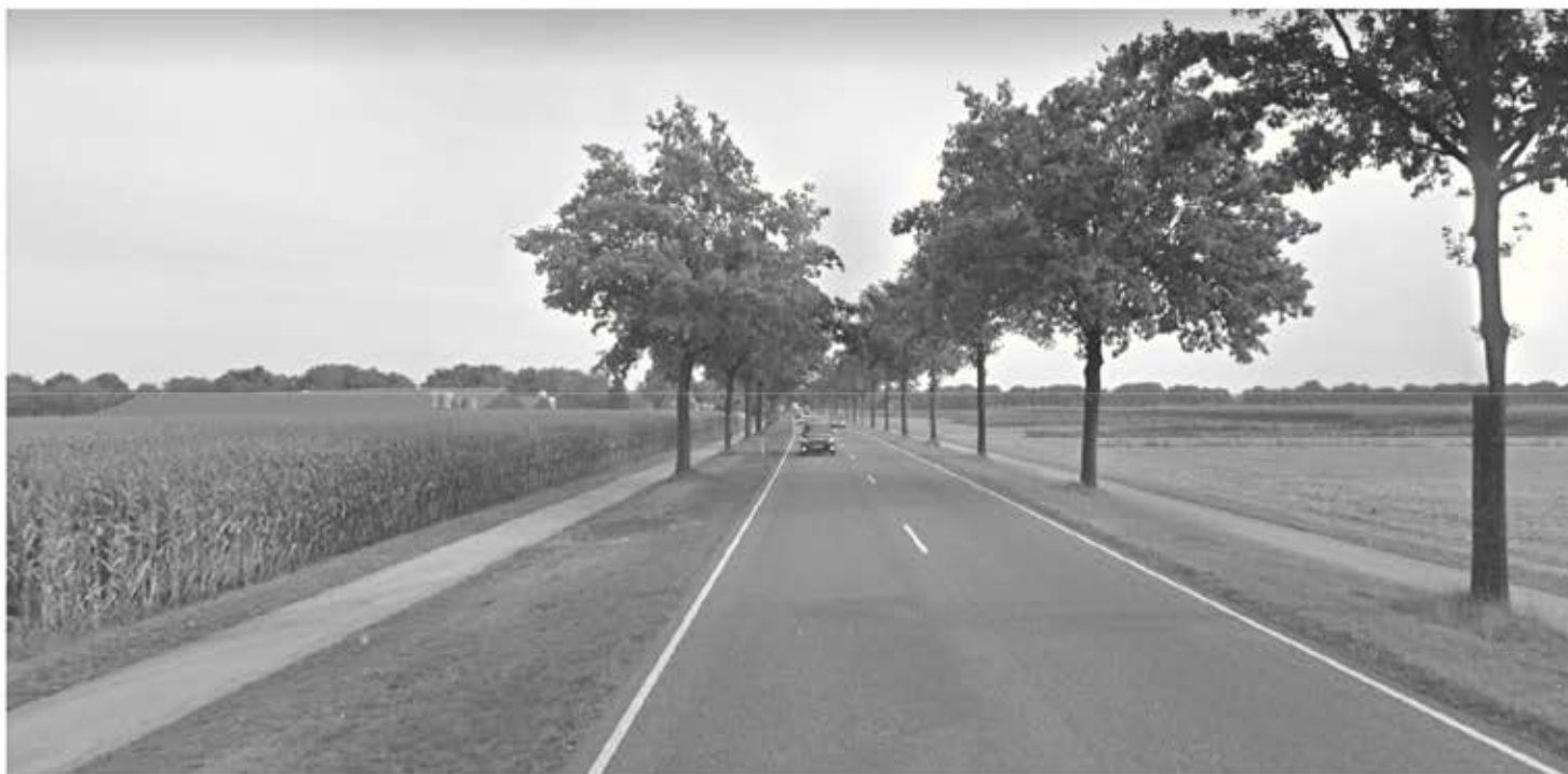
Zou het er voor fietsers beter op worden?

In de komende bestuursvergadering bespreken we de voortgang van de realisatiemogelijkheden van de vier suggesties die in het vorige Ventiel zijn genoemd. In het volgende Ventiel meer hierover.