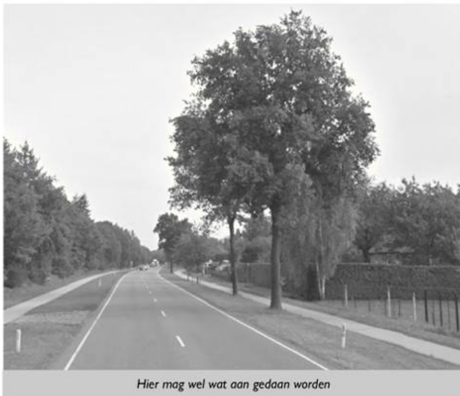
Hier mag wel wat aan gedaan worden

• De kruising Vlierdenseweg/Binderendreef: het tweerichtingen fietspad is gevaarlijk, automobilisten verwachten hier geen fietsers uit twee richtingen.