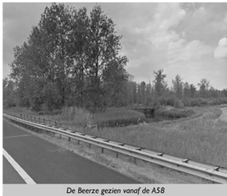
De Beerze gezien vanaf de A58

Ook is kort gesproken over fietsvoorzieningen, zoals de mogelijkheid om snelfietsend naar Tilburg te gaan. Waar nodig en mogelijk zouden bij de herinrichting van de A58 voorzieningen voor een snelfietspad bij de bouw van viaducten en bruggen kunnen worden meegenomen. Het enige concrete is op dit moment dat het er naar uitziet dat ter plaatse langs de Beerze een fiets- en wandelpad komen te liggen die gezamenlijk onder de A58 door gaan.