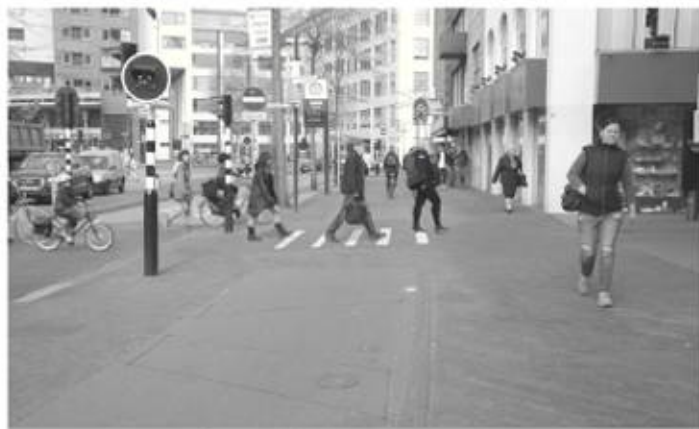
Oversteek binnenring met zebra

eindhoven@fietsersbond.nl of 06 5175 8275 (Pieter Nuiten).