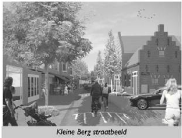
Kleine Berg straatbeeld

Over de uitkomst van de telling op de Kleine Berg schrijft Vinotion: 'ViNotion heeft ruim 75.000 verkeersdeelnemers geteld. Meer dan de helft daarvan waren voetgangers, daarna fietsers (42%), auto's (6%) en vrachtwagens (1%). Tijdens wekdagen veroorzaakten fietsers duidelijke pieken tijdens de spitsuren. In de weekenden was er een verdubbeling van het aantal voetgangers t.o.v. de wekdagen. Met recht een levendig stuk Eindhoven.'