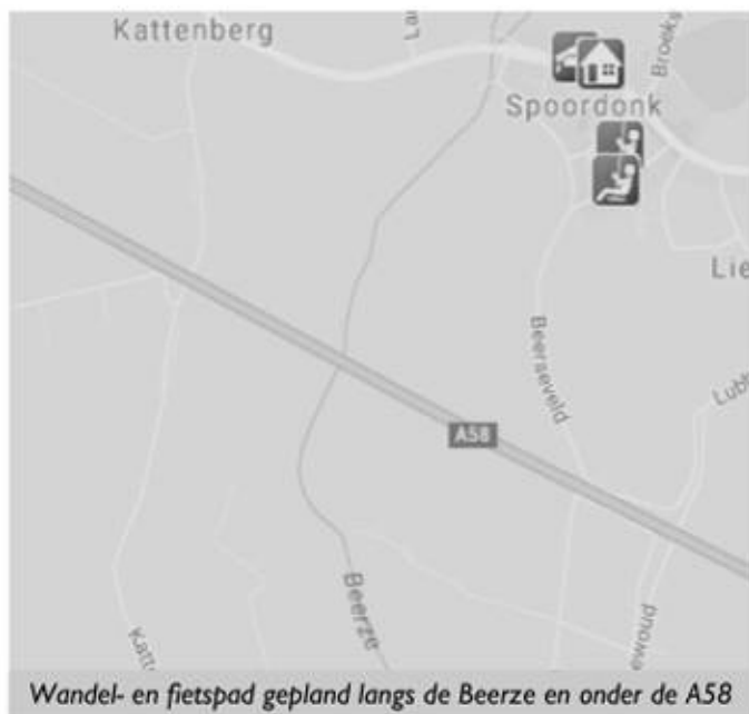
Wandel- en fietspad gepland langs de Beerze en onder de A58