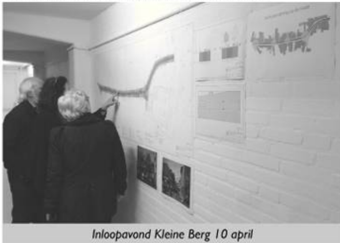
Inloopavond Kleine Berg 10 april

bezien zou kunnen worden in combinatie met plannen voor de omliggende gebieden, in het bijzonder de herinrichting van de Grote Berg waar nu ook al over nagedacht wordt.