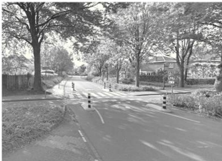
Kruising Lyndakkers/Oude Kerkdijk met de Hoge Brake/Meerijlaan De ene na de andere aanrijding;; wat is hier mis?

door, een autotunnel onder het spoor door of een verdiepte aanleg van het spoor ter plaatse. Wij blijven in ieder geval pleiten voor een ongelijkvloerse oversteek maar vrezen dat door de stagnerende discussie het zal uitdraaien op een "tijdelijke", gevaarlijke gelijkvloerse oversteek.