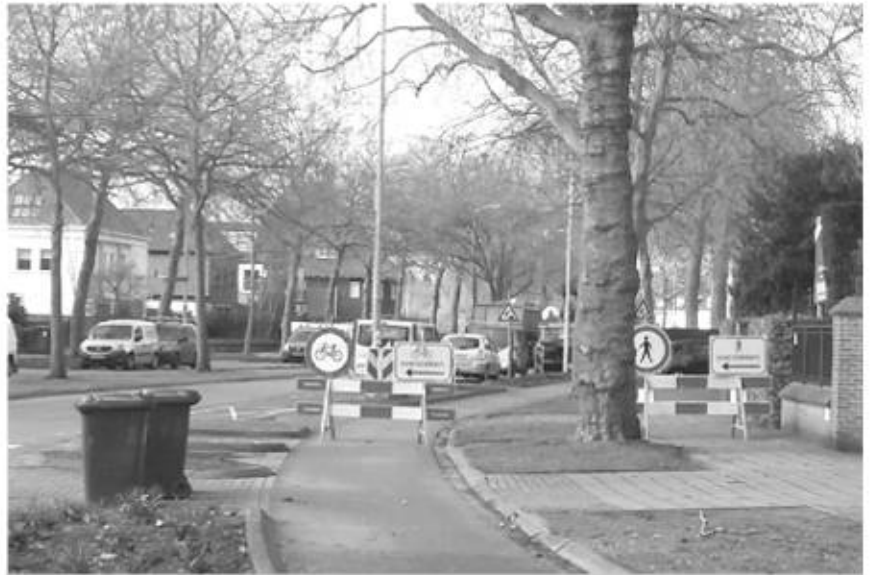
En hiertegenover zo'n zelfde verwijzing, naar deze kant

Op de Dr. Schaepmanlaan in Eindhoven is goed te merken dat het beter gaat met de economie. De ene na de andere villa wordt afgebroken of stevig verbouwd, soms recht tegenover elkaar en dat levert dan de nodige problemen op voor fietsers en voetgangers. En soms aan weerszijden van de straat. Autoverkeer wordt door deze particuliere bouwers en aannemers overigens nooit geblokkeerd.