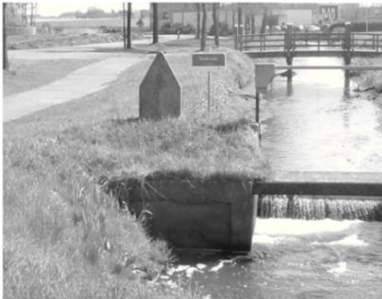
Links aanleg autoweg, ter hoogte van de Peeldijk, fietspad en beek

Voor het plan is 1,7 miljoen euro beschikbaar. Niet echt veel, maar misschien wel voldoende om een van de trajecten van belangrijke aanpassingen te voorzien. Vooralsnog zijn nog geen actieve stappen voor realisatie ondernomen. Een verbeterde route betekent winst voor het woon-werk- school- en recreatief verkeer.