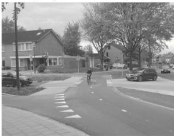
Fietspaden Europalaan in de voorrang

In het kader van de Lokale aanpak Veilig Fietsen hebben wij samen met VVN het initiatief genomen tot een Fietsveiligheidsenquête in de gemeente Nuenen van september t/m november 2016. Dat heeft een flinke respons opgeleverd: maar liefst 310 fietsers hebben gereageerd, overwegend ouderen. Een 62-tal mensen meldt dat ze een ongeluk hebben gehad of zijn gevallen, waarvan bij 39 sprake was van een eenzijdig ongeval, zoals valpartijen door onbalans of stuurfouten maar ook door infrastructurele zaken als gladde stenen randen, fietspaaltjes, slecht wegdek enz. De overige 23 betroffen aanrijdingen waarvan 9 met een auto. Hiervan vonden er 5 plaats op dezelfde locatie, namelijk op de kruising van het fietspad Lyndakkers/Oude Kerkdijk met de Hoge