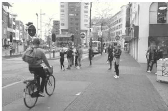
Oversteek binnenring zonder zebra

Eén van de punten waar we als afdeling het meest op worden aangesproken zijn de oversteken van de binnenring. De binnenring van Eindhoven is een drukke route, voor zowel fietsers als auto's als voetgangers. Omdat de gemeente het winkelgebied graag wil laten overlopen naar de Bergen en het Dommelkwartier zijn de oversteken enige tijd terug opgepoetst. Dat is met name gedaan door een andere materialisering van de oversteken (voor voetgangers van centrum naar Dommelstraat, naar Kleine Berg, naar Fensterrein). Ook zijn de verkeerslichten op het kruisvlak voetgangers/fietsers verwijderd. In praktijk stopte daar slechts een enkele fietser zodat het een schijnoplossing was. Op dit moment hebben fietsers op het fietspad voorrang op overstekende voetgangers. Niet alle voetgangers realiseren zich echter dat ze een fietspad oversteken, niet alle fietsers houden rekening met overstekende voetgangers. Dat probleem is voor bijvoorbeeld slechtzienden nog veel groter.