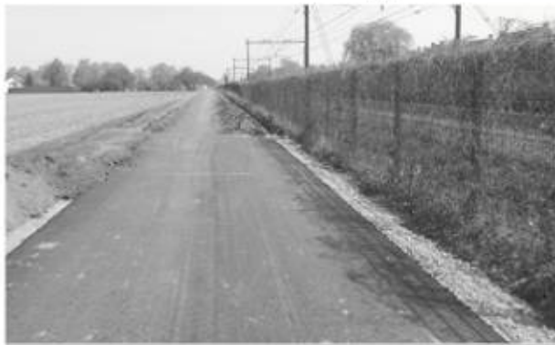
Snelfietspad, nu de toplaag nog