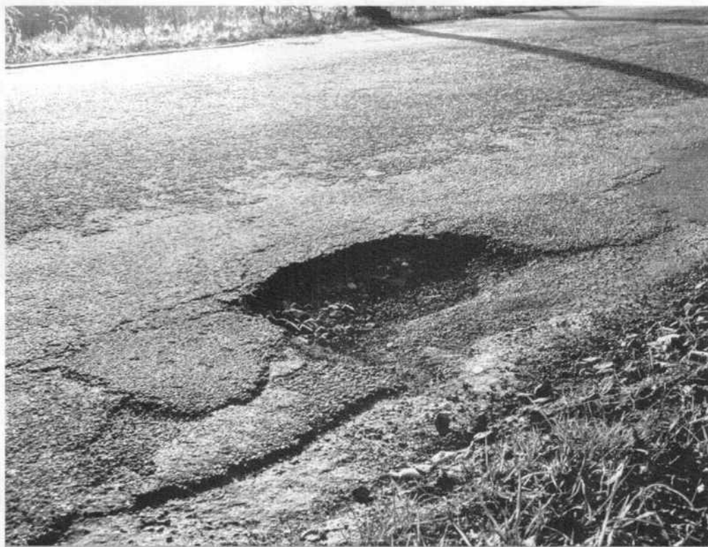
Gaten in de Collseweg

Om te voorkomen dat het Grote Bos ook als sluiproute gaat dienen en ook vanuit oogpunt van veiligheid voor fietsers rond het Strabrechtcollege vinden wij het beter als het Grote Bos gewoon ingericht wordt als 30-km weg, met vrijliggend fietspad dus.