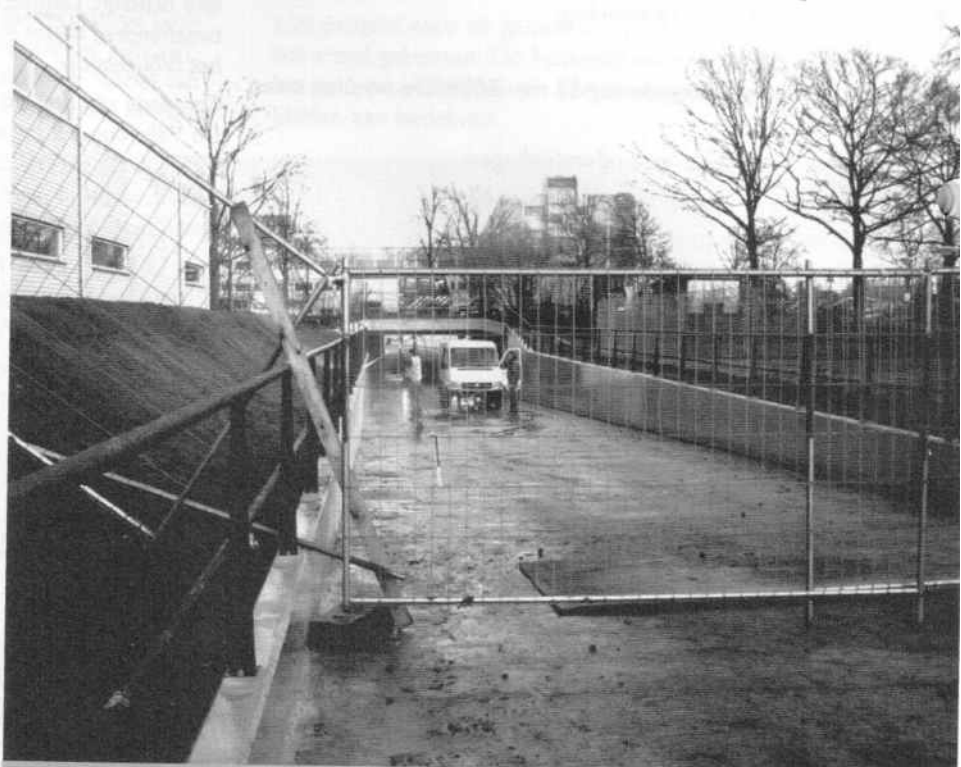
Het fietstunneltje langs de Dommel onder de rondweg wordt dit jaar weer opengesteld.

Geen bijzonderheden. De begroting wordt goedgekeurd.