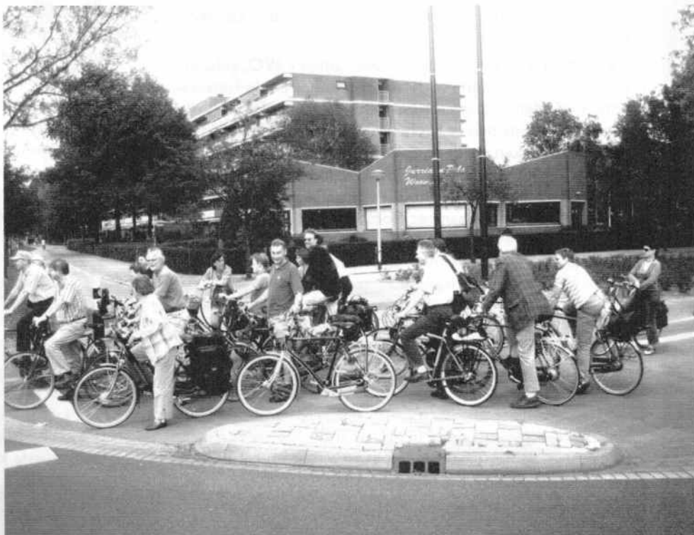
Fietstocht Eindhoven - onderweg

Met dank aan de onderafdeling Eindhoven voor de organisatie en gastvrijheid! De fraaie locatie (met "groen" terras!) was een uitstekende keuze.