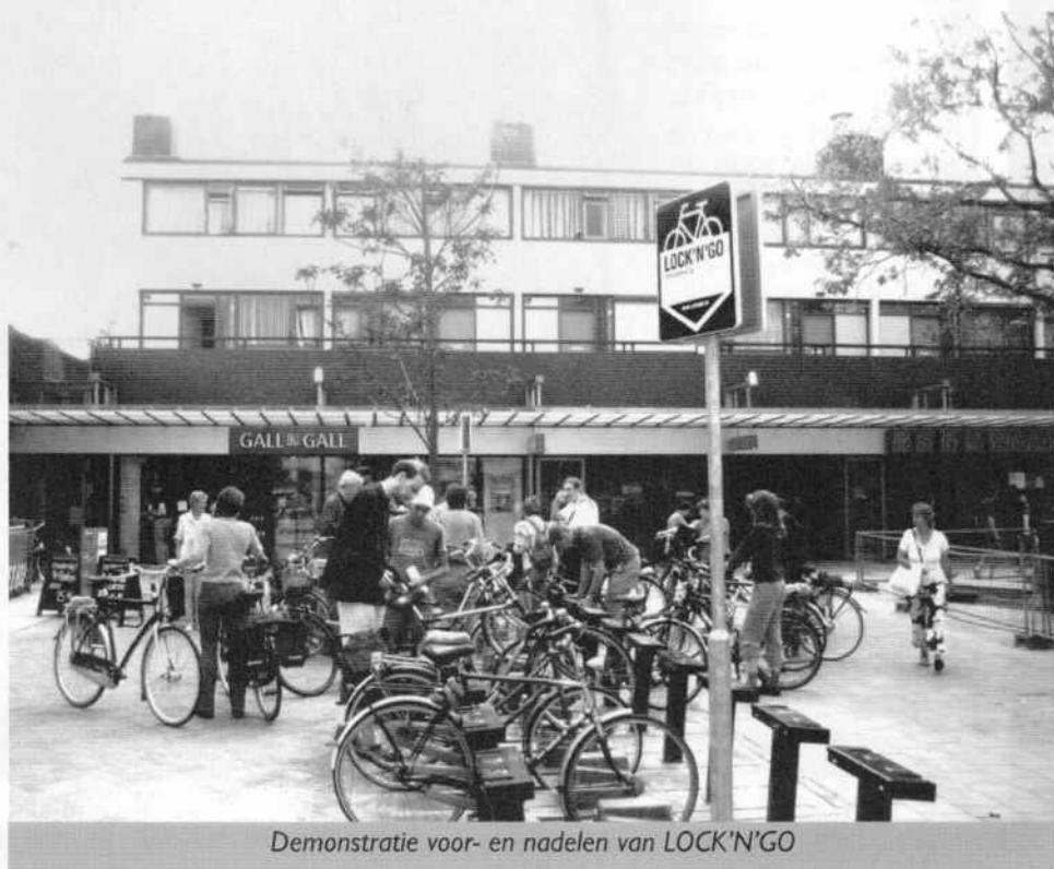
Demonstratie voor- en nadelen van LOCK'N'GO