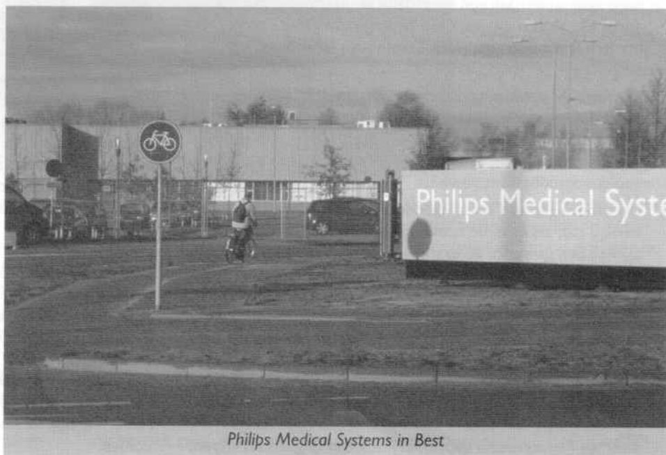
Philips Medical Systems in Best

Het project voor de genoemde vier bedrijven is met subsidie tot stand gekomen. De Fietsersbond overweegt om in 2007 het gedane onderzoek als een (te betalen) service aan te gaan bieden aan bedrijven.