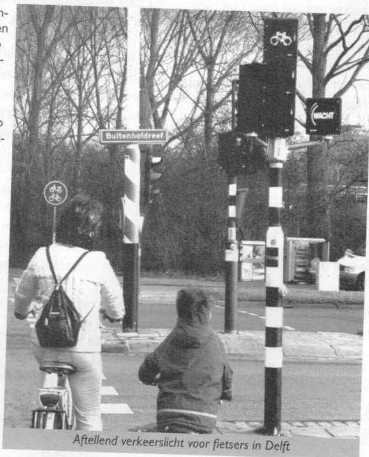
Aftellend verkeerslicht voor fietsers in Delft

Enkele steden in Nederland hebben dat inmiddels wel gedaan, waaronder Delft. Daar is op 24 januari op een drukke kruising de eerste