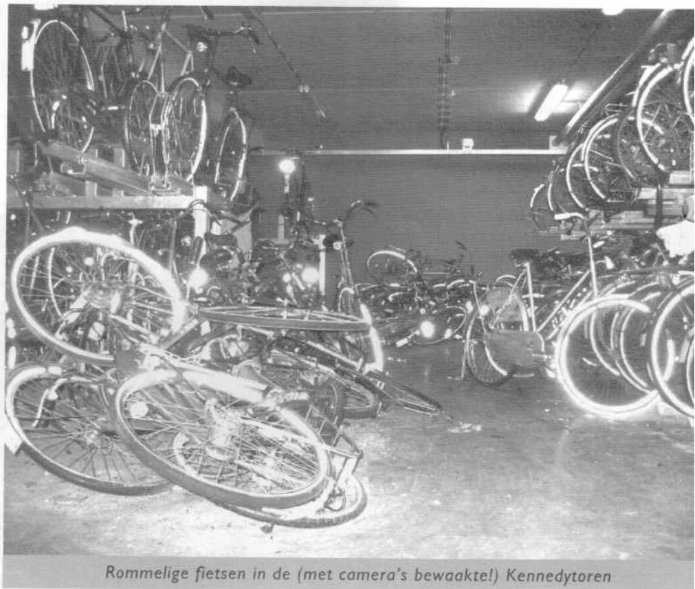
Rommelige fietsen in de (met camera's bewaakte!) Kennedytoren

Na de in 2006 aangenomen fietsnota, wordt op dit moment hard gewerkt aan een aparte fietsparkeernota. En daar is dringend behoefte aan! Zonder fietsparkeerbeleid kan er eigenlijk niet zinnig gesproken worden over de precieze vorm die de nieuwe ondergrondse stalling op het 18 Septemberplein gaat krijgen (bewaakt? betaald?). Fietsparkeren speelt een centrale rol bij de problematiek rond de herinrichting van de Kerkstraat. En het is ook onduidelijk hoe