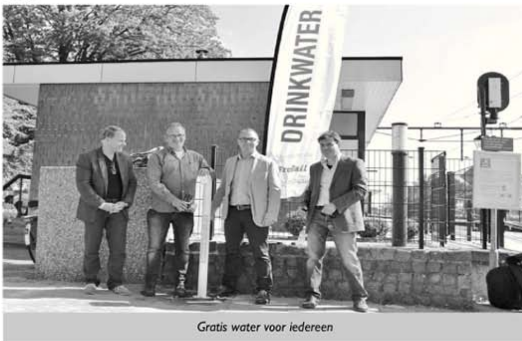
Gratis water voor iedereen

De wijkraad was dit een doorn in het oog, maar de leden gingen niet bij de pakken neerzitten. Bij een schilder in de Walsberg werd verf geregeld en door inzet van een tiental vrijwilligers kregen de bruggen hun mooie helderrode kleur terug.