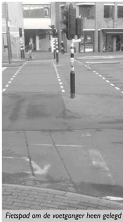
Fietspad om de voetganger heen gelegd

gewoontes. Dus zie je om de haverklap voetgangers over het fietspad lopen, zoals ze gewend waren. Als ze wel netjes over het voetpad oversteken, lopen ze overigens de kans dat ze door fietser van achteren worden 'aangevallen'. Je moet ogen in je achterhoofd hebben.