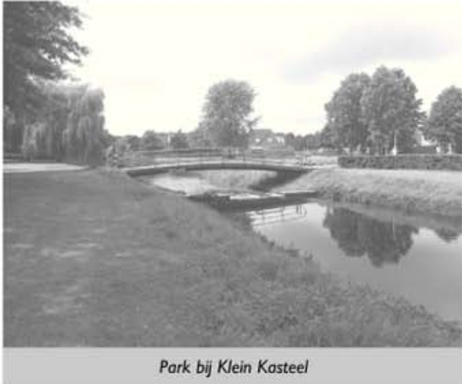
Park bij Klein Kasteel

In de wijk Heiakker ligt in een parkachtige omgeving het Klein Kasteel, met de daarbij horende waterpartijen. En bij waterpartijen horen ook bruggen, in dit geval twee fiets-/voetgangersbruggen en een gewone verkeersbrug. Die bruggen waren al een tijd toe aan een laagje verf, maar doordat de gemeente geen geld heeft, werd het schilderwerk alsmat niet gedaan.