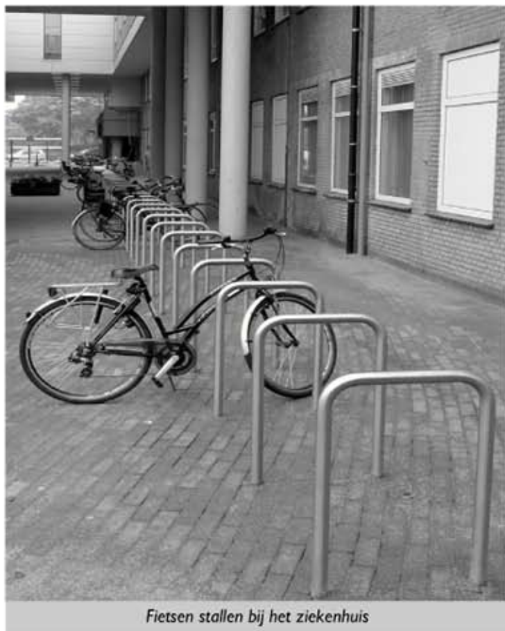
Fietsen stallen bij het ziekenhuis

Aan de westzijde van Stiphout wordt komend jaar de Stiphoutse Dreef aangelegd, waardoor autoverkeer uit Stiphout richting westen en zuidwesten niet meer via de Dorpsstraat hoeft. Een groot voordeel van de nieuwe weg is, dat na de aanleg van de nieuwe tangent de oude route via de nu veel te krappe en gevaarlijke Schootenseweg beschikbaar komt voor fietsers, onder