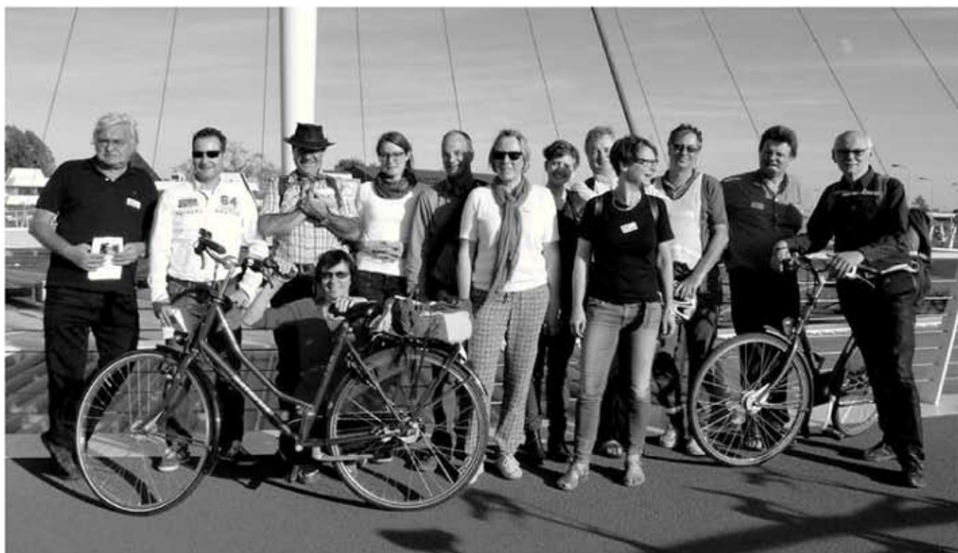
De Belgische Fietsersbond op de Hovenring

Ik vond het leuk deze tocht te organiseren. Voor mij was het een kans me te verdiepen in verschillende oplossingen voor fietsinfrastructuur die er in Eindhoven zijn (gekozen) en daarnaast was het heel dankbaar werk onze Belgische collega's hier rond te leiden.