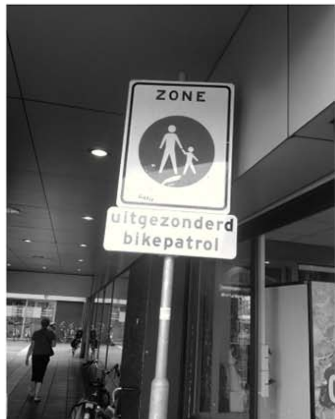
Ook geen idee wat een bikepatrol is?

In Frankrijk is een fietstent in productie genomen waardoor je van boven niet nat wordt (roofbi). Het winkelcentrum Woensel is voetgangersgebied. Op borden is dat ook duidelijk aangegeven. Met één uitzondering. Een nieuw onderbord geeft dat in helder Nederlands aan: uitgezonderd bikepatrol (zie foto).