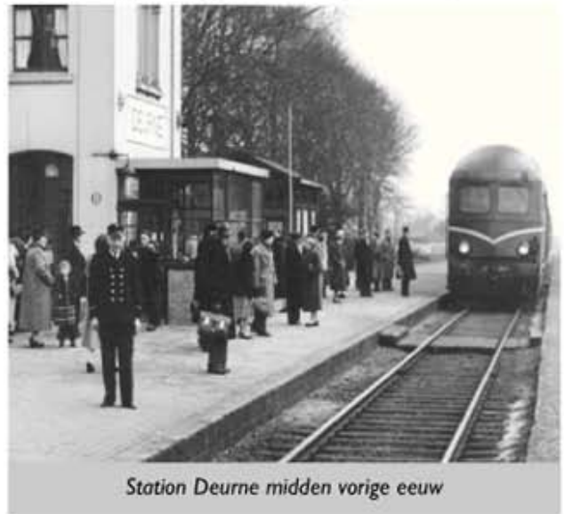
Station Deurne midden vorige eeuw

Er zijn inmiddels weidebloemen ingezaaid, er zijn planten gezet en er staat sinds 12 september een watertappunt. Dit watertappunt is geleverd door Join the Pipe en is