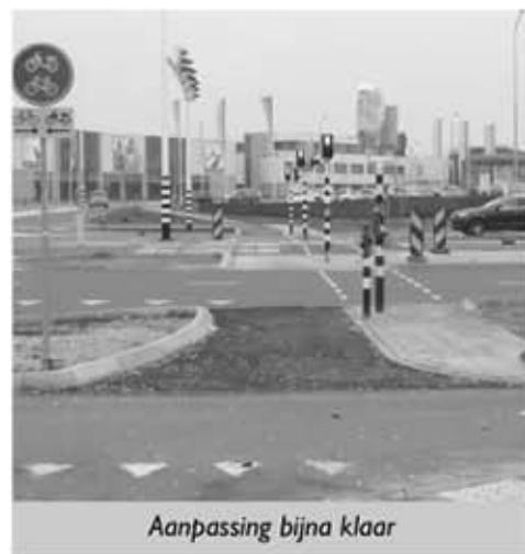
Aanpassing bijna klaar